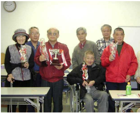
トロフィーを手にした入賞者と役員