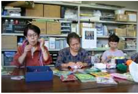
楽しいおしゃべりと編み物