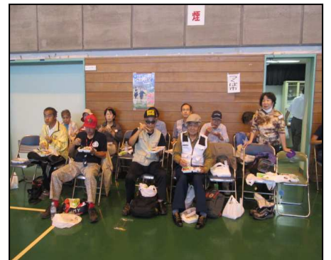
応援席の皆さん お昼ご飯は美味しいお弁当