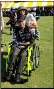
左：パン食い競争でメロンパンを 右：お宝探検 中身は何か？