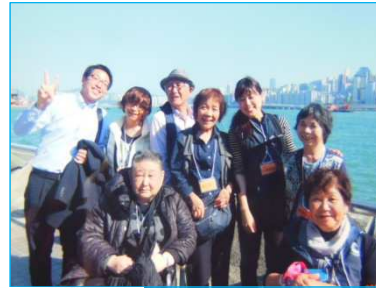
お仲間と香港旅行を楽しむ東郷さん