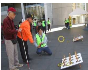
輪投げ競技 「ご褒美にボールペン」